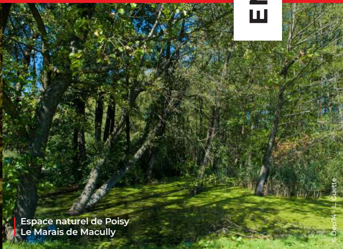
Espace naturel de Poisy Le Marais de Macully