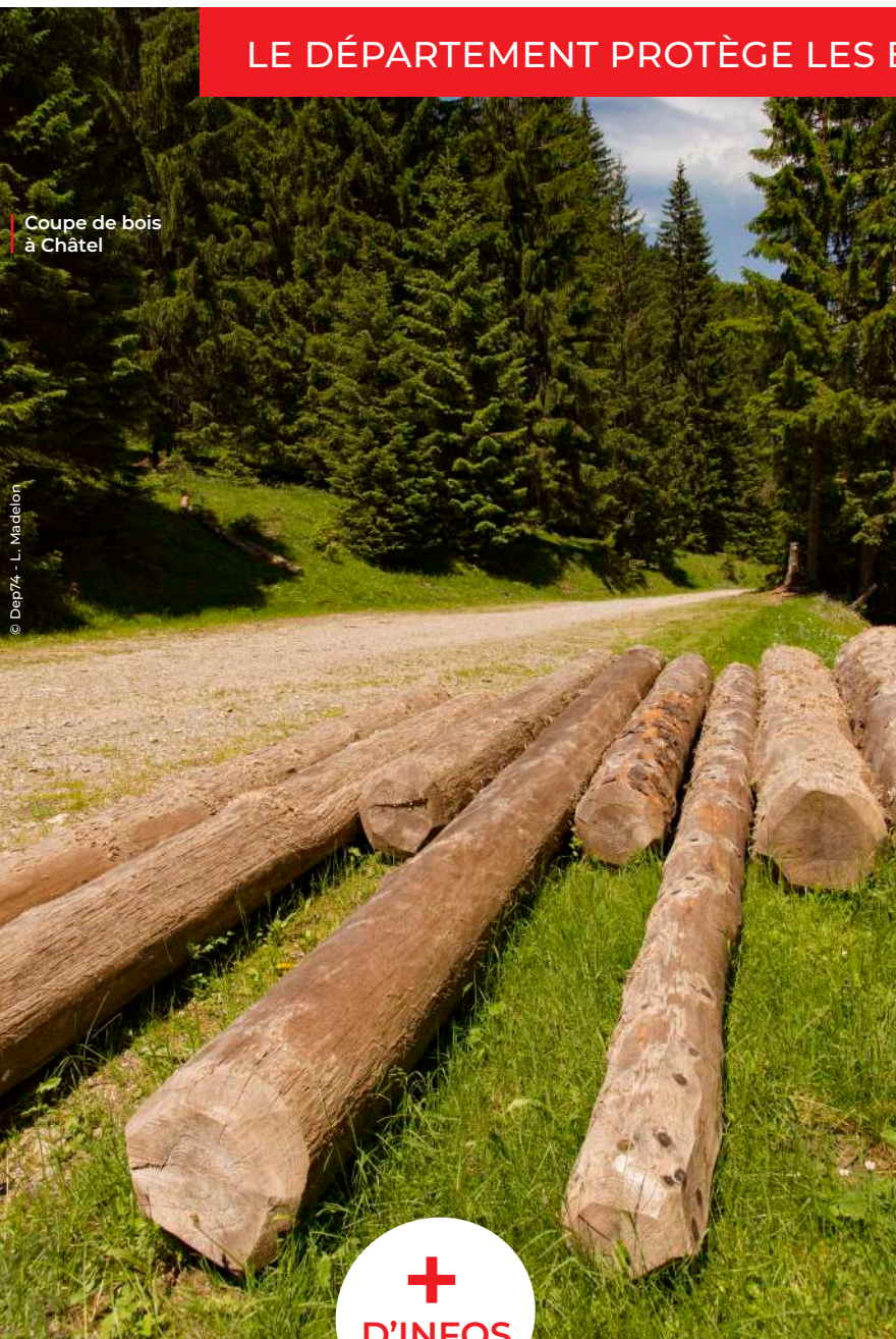
Coupe de bois à Châtel