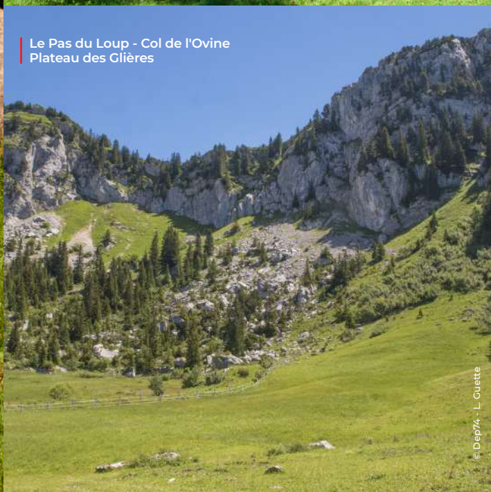
Le Pas du Loup - Col de l'Ovine Plateau des Glières