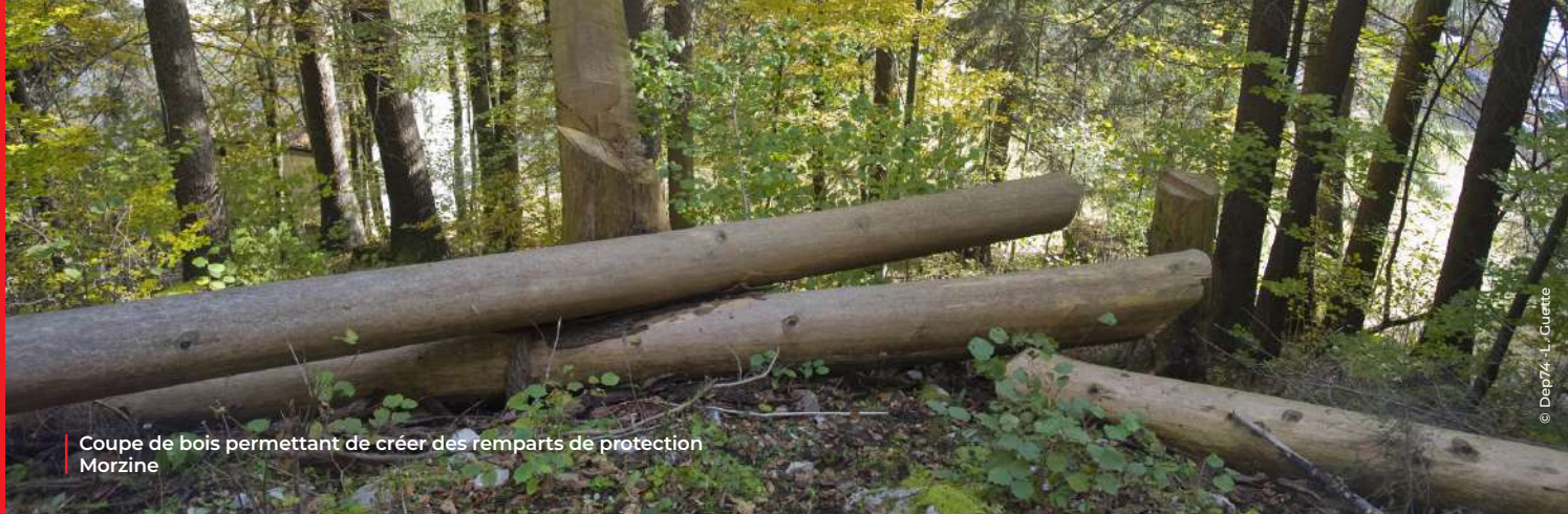
Coupe de bois permettant de créer des remparts de protection Morzine